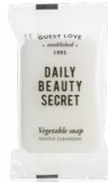
B0830GL 30 g e Net wt. 1.05 oz.