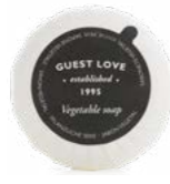
B0220GL 20 g e Net wt. 0.70 oz.