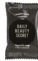
B0808GL 8 g e Net wt. 0.28 oz.