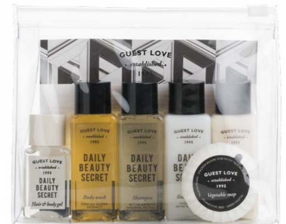
K052GL 15 x 12,5 x 4,5 cm

SALES DE BAÑO relajantes con aroma de Naranja Amarga